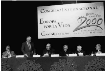
Im Kongressaal: die Bühne

Spanisch verstanden, fühlten wir doch durch Stimmung und mitreisende Lieder ihre Botschaft.