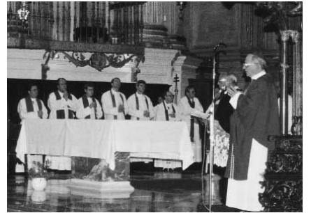
Abschliessender Festgottesdienst in der Kathedrale von Granada