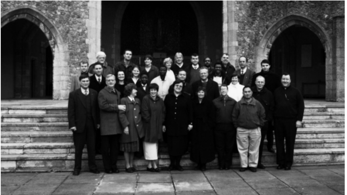
HLI-Vertreter aus 16 Nationen vor dem Hauptportal des Klosters Aylesford

Die Geschichte der Bruderschaft in Aylesford, einem kleinen Dörflein südlich von London, begann im Jahre 1242, als Kreuzfahrer eine Gruppe von Karmeliter auf dem Heimweg vom Heiligen Land mit nach England nahmen. Die Karmeliten bewohnten ein kleines Landstück, das ihnen von einer Familie Grey zur Verfügung gestellt wurde. Fünf Jahre später bauten sie mit der Erlaubnis des Bischofs und mit der Hilfe von Spenden eine Kirche und ein Ordenshaus. Im Verlauf der Jahrhunderte sah das Kloster viele Höhen und Tiefen. Der Orden blühte rasch auf und verbreitete sich über ganz England. Klöster wurden neu auf- und ausgebaut. Die Brüder führten ihr Gebetsleben wie auch heute noch mit dem Zentrum der täglichen Messe. Daneben predigten sie, unterstützten den lokalen Klerus bei der Arbeit und führten auch selber Schulen.