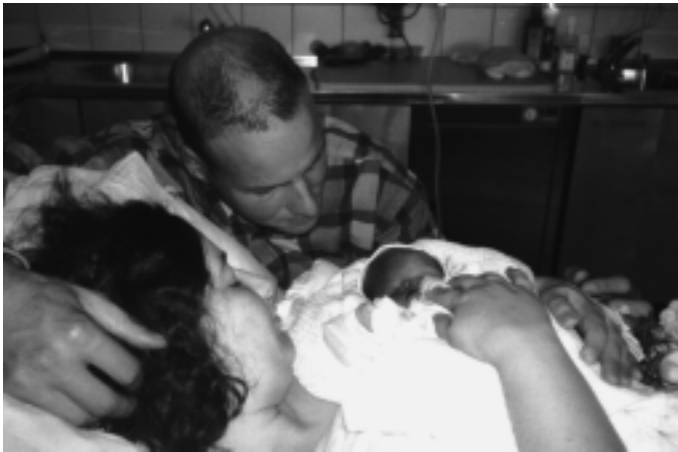
Abschiednehmen gleich nach der Geburt