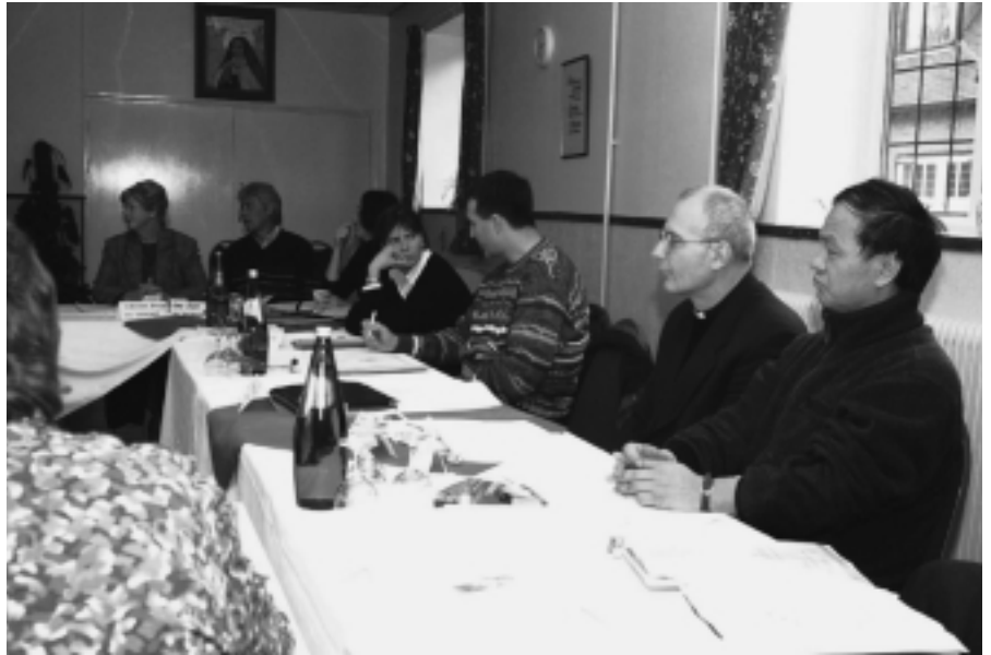
Intensiver Austausch für die zukünftige internationale Zusammenarbeit

In dieser wunderschönen, geschichtsträchtigen Umgebung fand im Februar ein internationales HLI-Treffen statt. Ziel des Treffens war das Kennenlernen des neuen Präsidenten des HLI, Father Tom Euteneuer, der gegenseitige Austausch und die Ausarbeitung neuer Strategien zum weltweiten Zusammenarbeiten für den Schutz des Lebens. Teilnehmer waren HLI-Mitarbeiter von allen Kontinenten. Neben einigen Vertretern aus den USA, vom Hauptsitz in Front Royal, waren auch Vertreter aus Kanada, Kamerun, Tansania, den Philippinen, Neuseeland, Südafrika, England, Deutschland, Österreich, Kroatien, Italien, Südkorea, Polen und Irland anwesend. Aus der Schweiz waren Dr. Urs Kayser und Rachel Ziegler dabei. In der täglichen Messe und dem