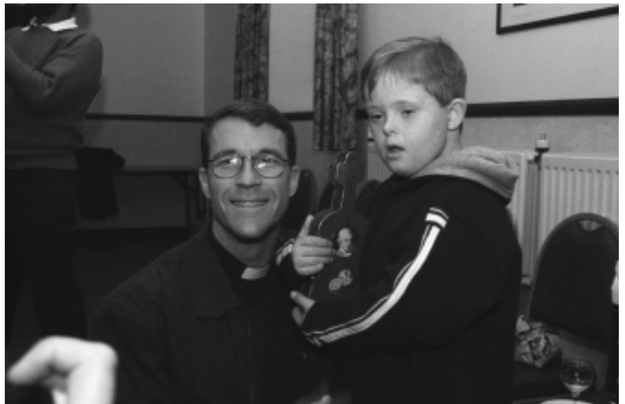
Der neue HLI-Präsident, Father Tom Euteneuer

benutzt. Einige Male entging die Priorei nur knapp der Verwüstung. So zum Beispiel einmal einer Feuersbrunst oder während des 2. Weltkrieges. Erst vor ungefähr