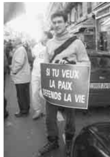
Auch auf Rollerblades lässt sich gut demonstrieren. Im Hintergrund ein Mitglied der Schweizer Delegation.

Die Atmosphäre an der Demonstration war sehr dicht. Erfreulich die Präsenz zahlreicher junger Leute. Die Geschlechter unter den Teilnehmenden war durchaus ausgeglichen (selbst wenn die linke Zeitung „La Libération“ am Montag darüber polemisierte und alles aus fadenscheinigen Gründen zu einer Männerveranstaltung erklären wollte). Eine Gegendemonstration, welche eine Woche zuvor für die Fristen-„lösung“ durchgeführt wurde, konnte lediglich etwa halb so viele Teilnehmende mobilisieren. Vielleicht ein erstes hoffnungsvolles Zeichen einer allmählichen Trendwende.