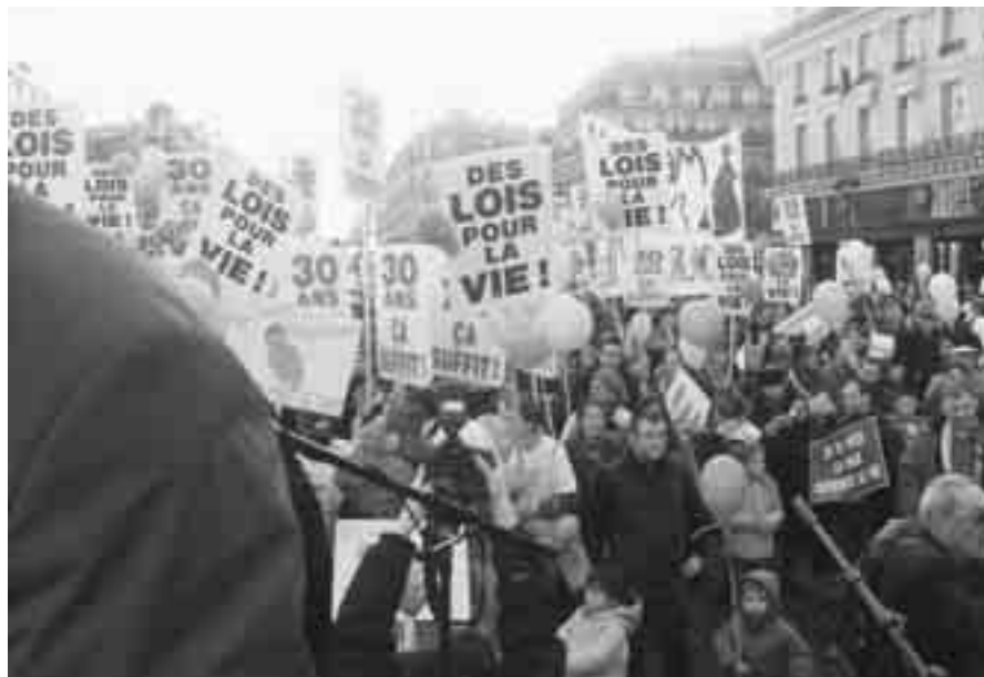
Eine aufgeräumte Atmosphäre auf der „Place de l'Opera“, dem Besammlungspunkt der Demonstration „trente ans ça suffit“!