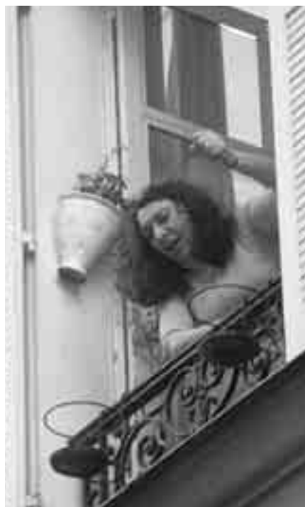
Aus dem Fenster kamen nicht nur Beschimpfungen durch vereinzelt GegendemonstrantInnen sondern auch ab und zu ein Kübel kaltes Wasser.

Historisch ist es durchaus so, dass im kontinentalen Westeuropa Frank-