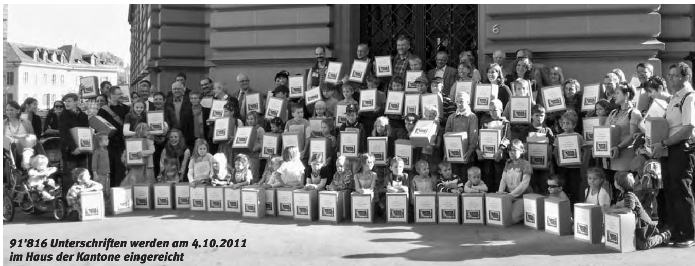
91'816 Unterschriften werden am 4.10.2011 im Haus der Kantone eingereicht

Am 17. Juni 2011 gab das Komitee «Gegen die Sexualisierung der Volksschule» die Lancierung der gleichnamigen Petition bekannt. Am 25. Juni 2011 begann die Unterschriftensammlung für die Petition, deren Ende auf den 1. Oktober 2011 terminiert war. Im Zeitraum von etwas mehr als drei Monaten haben 91'816 Bürgerinnen und Bürger diese Petition unterzeichnet, eine ebenso erstaunliche wie eindrucksvolle Zahl von Unterzeichnern.