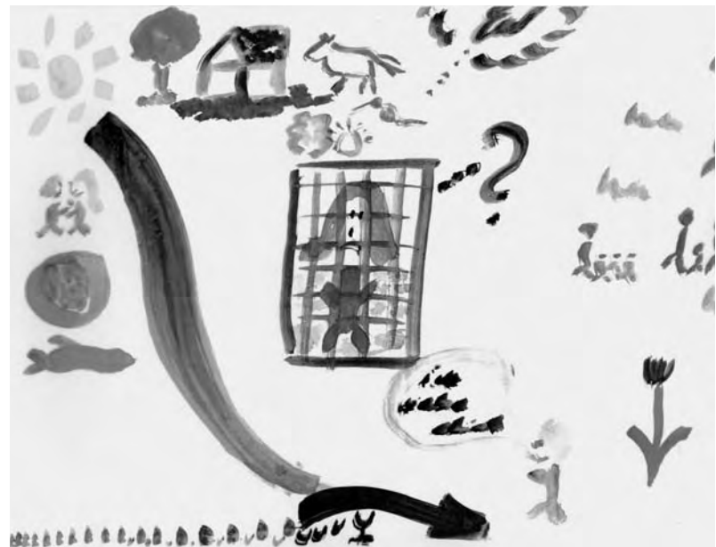
Gefangen und fixiert im Käfig der Depression.