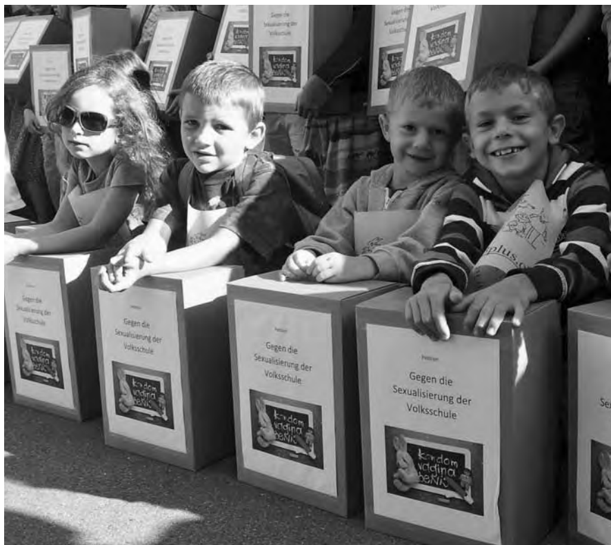
Zahlreiche Familien und Kinder waren bei der Unterschriftenübergabe anwesend.

Das Petitionskomitee gibt gegenüber allen kantonalen Bildungsdirektoren seiner bestimmten Erwartung Ausdruck, dass die von den Kantonen weder angeordneten noch finanzierten Aktivitäten des Luzerner Kompetenzzentrums unverzüglich unterbunden werden – so wie das der Öffentlichkeit versprochen worden ist.