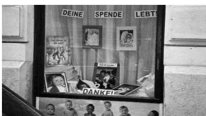
Schaufenster des Lebenszentrums