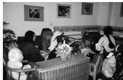
Schwangere Frauen arbeiten bei HLI-Österreich

In einer Schulung wurde uns das Know-how der Strassenberatung vermittelt. Zuerst galt es zu lernen, wie man möglichst früh erkennt, wer zur Klinik kommt. Wie spricht man die Leute an? In Rollenspielen probten wir, mit verschiedenen Verhaltensweisen der Frauen und ihrer Begleiter umzugehen, um anschliessend schon bald selbst auf der Strasse tätig zu sein. Sehr wichtig waren auch die Vorträge über das Post-Abortion Syndrom, über Vergebung und das Gebet und auch über den Umgang mit Misserfolgen, denn oft wird die an-