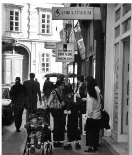
Vor einer Abtreibungsklinik in Wien

Im Rahmen meiner Mitarbeit bei HLI Schweiz durfte ich eine Woche nach Wien fahren, um das dortige HLI-Team zu besuchen, welches sich ganz auf die Thematik der Abtreibung spezialisiert hat und eine grosse Arbeit zur Verhinderung der Abtreibung vor Ort leistet.